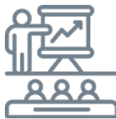
Salle de formation équipée