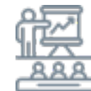
Salle de formation équipée